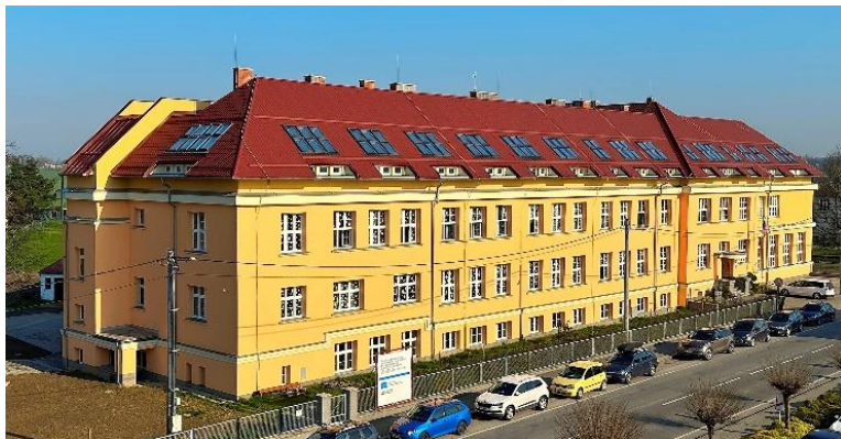
Budova školy na ul. Nádražní