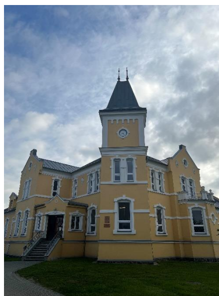
Budova ZŠ v Zábřehu